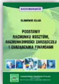
S. Sojak Podstawy rachunku kosztów, rachunkowości zarządczej i zarządzania finansami podręcznik i zbiór zadań