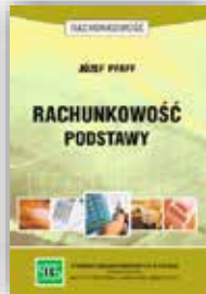
J. Pfaff Rachunkowość - podstawy podręcznik i zbiór zadań