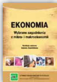
Ekonomia Redaktor naukowy I. Zawiślińska podręcznik i zbiór zadań