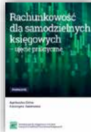
A. Cicha, K. Zasiewska Rachunkowość dla samodzielnych księgowych - ujęcie praktyczne podręcznik i zbiór zadań