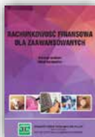
Rachunkowość finansowa dla zaawansowanych Redaktor naukowy W. Gabrusewicz